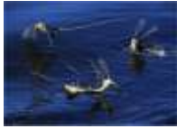
csúcsára állított háromszög kompozíció